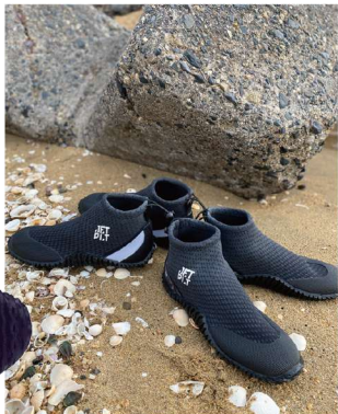
レジャー派ライダーに人気のハイドロシューズのハイカットモデルです。