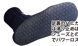
足裏のハニカムプリントは滑り止めはもちろんシューズとのズレを防止してパワーロスを抑えます。

足首内側はソックスがずり落ちるのを防ぐスライスキップ仕様。水の侵入を防ぎ体温キープ効果もUP。