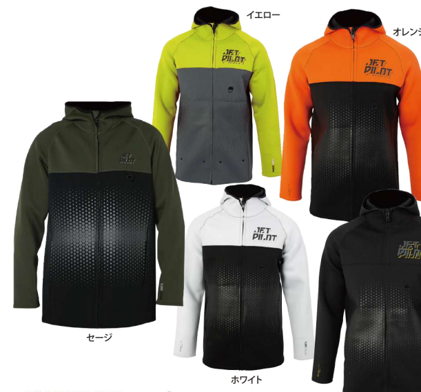
FLIGHT ツアーコート ¥21,780 (税抜¥19,800) JA22160 S、M、L、XL、2XL

ルーズフィットなシルエットで人気のモデル! 自由に組合せてセットアップスーツに!