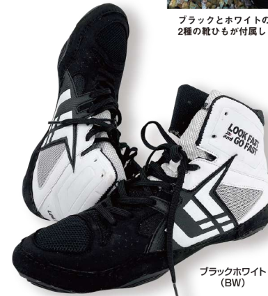
ブラックホワイト (BW)