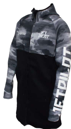
VENTURE ロングツアーコート ¥24,200 (税抜¥22,000) JA22164CM M、L、XL、2XL、3XL