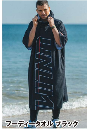
フーディータオル ブラック

¥7,920 (¥7,200 税別) ULP613 ●胸囲156×着丈120(cm)