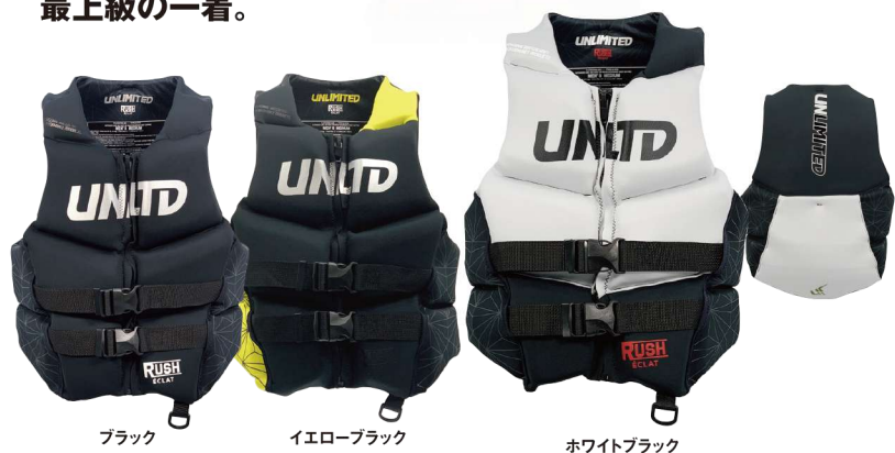
ブラック イエローブラック ホワイトブラック

RUSH エクラネオベスト ¥22,550 (税抜¥20,500) UV2301 XS、S、M、L、XL USコーストガード認定TYPEⅢ JCI予備検査合格実績型 救命ホイッスル装備