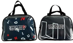
専用クリアバッグ付き!

左胸に絶対必需品の スマホ用メディアポケット完備! 左右に備えた大型サイドポケット には着がえもINできます!