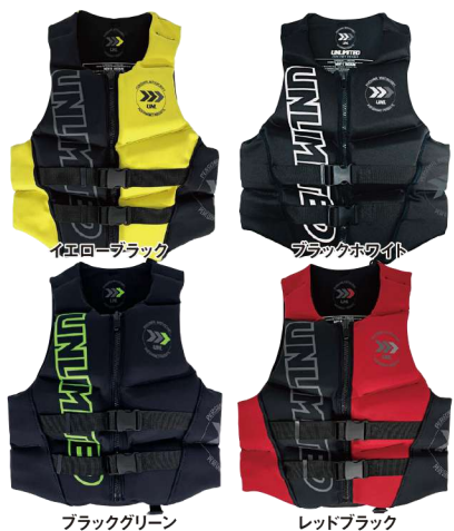
イエローブラック ブラックホワイト ブラックグリーン レッドブラック

ネオベスト ¥19,800 (税抜¥18,000) UV2101 S、M、L USコーストガード認定TYPEⅢ JCI予備検査合格実績型 救命ホイッスル装備