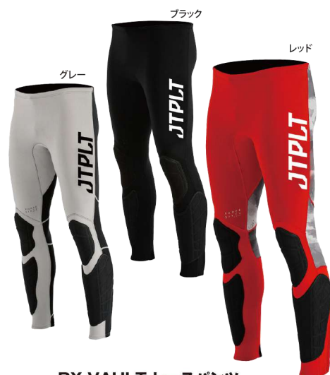
RX VAULT レースパンツ ¥23,100 (¥21,000 税別) JA22157 M、L、XL、2XL