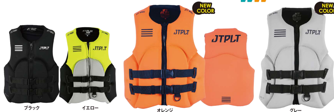
ブラック イエロー オレンジ オレンジ グレー