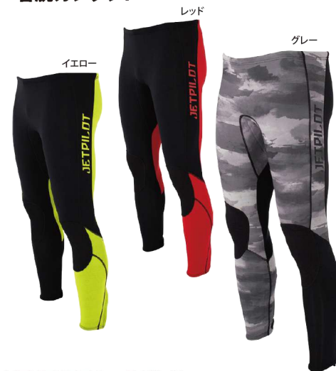
VENTURE レースパンツ ¥19,800 (¥18,000 税別) JA22153 M、L、XL、2XL

レギンスやインナーパンツとの組合せがトレンド急上昇! ネオプレンのハーフパンツはPWCユーザーに大人気!