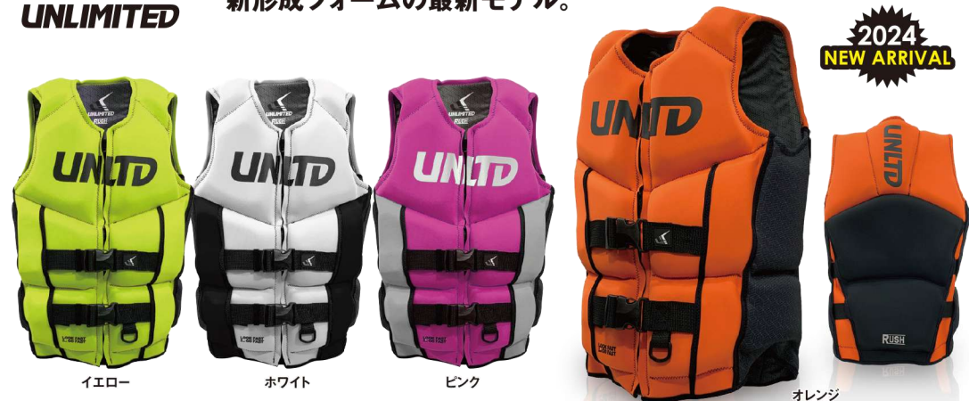
イエロー ホワイト ピンク オレンジ