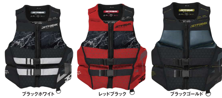
ブラックホワイト レッドブラック ブラックゴールド

SURGE ネオプレン ¥23,100 (税抜¥21,000) SL3277 M、L、XL、2XL USコーストガード認定TYPEⅢ JCI予備検査合格実績型 救命ホイッスル装備