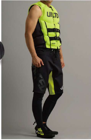
UNLIMITEDウェアでカラーコーディネートがおススメ!