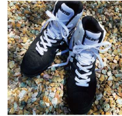
ブラックとホワイトの2種の靴ひもが付属します。