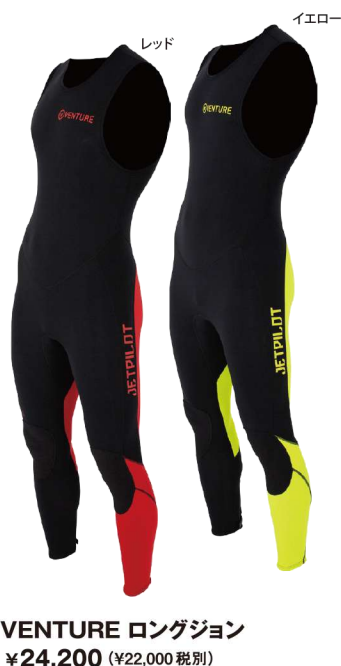
VENTURE ロングジョン ¥24,200 (¥22,000 税別) JA22154 M、LS、L、XLS、XL、2XL