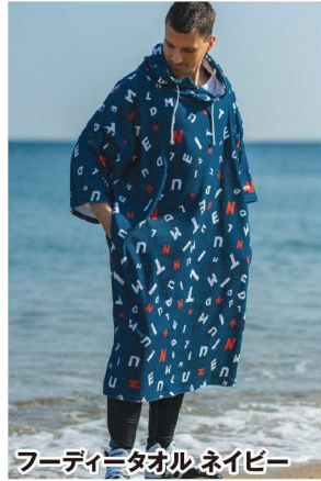
フーディータオル ネイビー

長めの丈が強い日差しや冷たい風からボディを守ってくれます。 スリットが入っているから足さばきもGOOD。