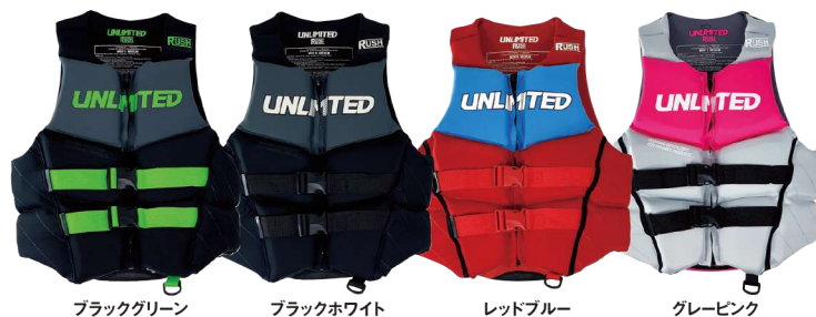
ブラックグリーン ブラックホワイト レッドブルー グレーピンク

RUSH エクラネオベスト ¥22,550 (税抜¥20,500) UV2301 XS、S、M、L、XL USコーストガード認定TYPEⅢ JCI予備検査合格実績型 救命ホイッスル装備