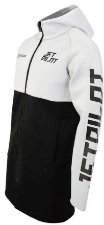
VENTURE ロングツアーコート ¥23,100 (税抜¥21,000) JA22164 M、L、XL、2XL、3XL