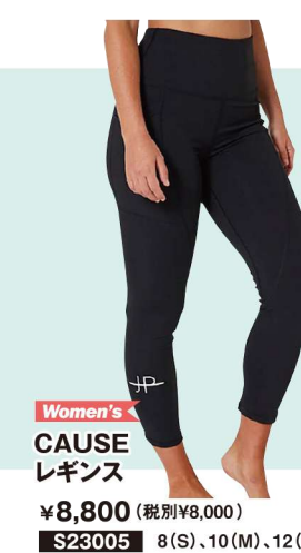
Women's CAUSE レギンス ¥8,800 (税別¥8,000) S23005 8(S)、10(M)、12(L)