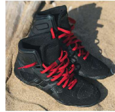
ブラックとレッドの2種の靴ひもが付属します。