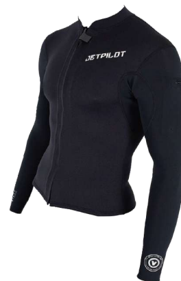
VENTURE ジャケット ¥15,180 (税抜¥13,800) JA22158 M、LS、L、XLS、XL、2XL、3XL