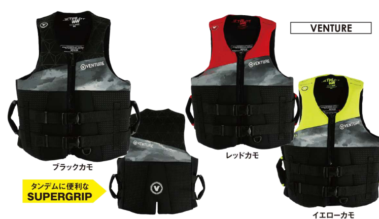
ブラックカモ レッドカモ イエローカモ

ベンチャー CGA ベスト ¥21,780 (税抜¥19,800) JA23114 M、L、XL USコーストガード認定TYPEⅢ JCI予備検査合格実績型 救命ホイッスル装備