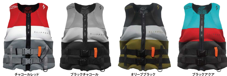
チャコールレッド ブラックチャコール オリーブブラック ブラックアクア

フリーライド ネオ CGA ベスト ¥23,100 (税抜¥21,000) JA23113 M、L、XL、2XL USコーストガード認定TYPEⅢ JCI予備検査合格実績型 救命ホイッスル装備