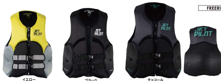
イエロー ブラック チャコール

ベンチャー ネオ CGA ベスト ¥23,100 (税抜¥21,000) JA22114 M、L、XL、2XL USコーストガード認定TYPEⅢ JCI予備検査合格実績型 救命ホイッスル装備