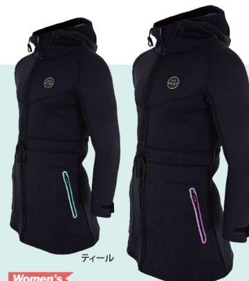
Women's VENTURE レディースロングコート ¥27,280 (税別¥24,800) JA21264 M、L、XL