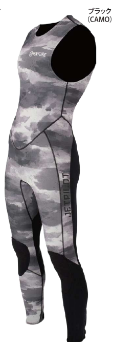
VENTURE ロングジョン ¥24,200 (¥22,000 税別) JA21154 M、LS、L、XLS、XL、2XL