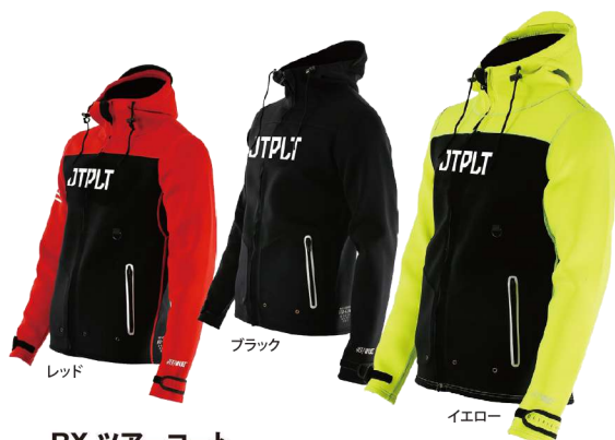
RX ツアーコート ¥28,600 (税抜¥26,000) JA22171 M、L、XL、2XL、3XL

自由なセットアップなら、季節や予算にあわせたウェア選びができます。 水面で遊ぶジェットスポーツだからこそオリジナルコーデが楽しめます。