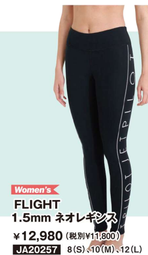
Women's FLIGHT 1.5mm ネオレギンス ¥12,980 (税別¥11,800) JA20257 8(S)、10(M)、12(L)