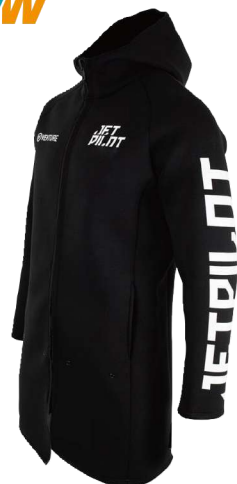
VENTURE ロングツアーコート ¥23,100 (税抜¥21,000) JA21164 M、L、XL、2XL、3XL

VENTUREコートはサイズ選びもシンプルで 3シーズン活躍するマストアイテムです。