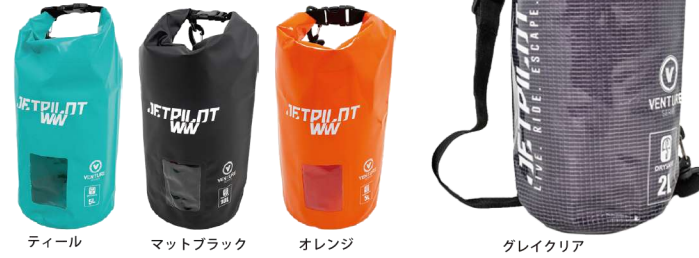
ティール マットブラック オレンジ グレイクリア