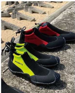
足甲部は通気性のよいエアブレン仕様で、グリップ力に優れたラバーパターンソールは柔軟なのに頑丈です。