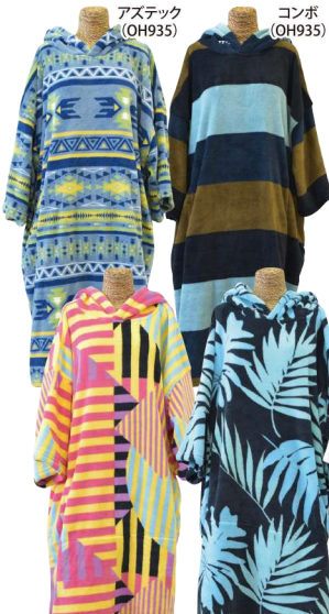
アステック (OH935) コンボ (OH935) アレコリズム (OH935) モンスター (OH935) チェック (OH935)

マイクロファイバーポンチョ ¥5,830 (¥5,300 税別) OH935 ●胸囲158×着丈111(cm)