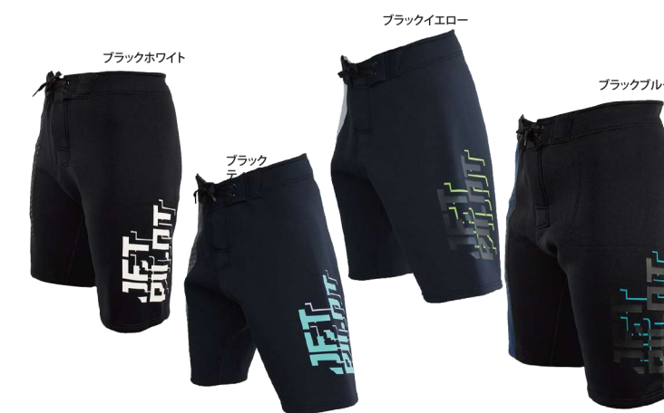
FLIGHT NEO ボードショーツ ¥15,180 (¥13,800 税別) JA22900 M、L、XL、2XL

レギンスやインナーパンツとの組合せがトレンド急上昇! ネオプレンのハーフパンツはPWCユーザーに大人気!